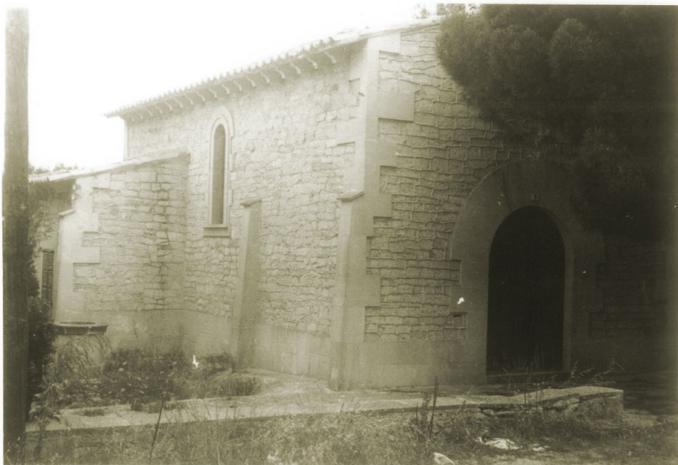
Església de Cala Figuera 1973

A l'interior, dos arcs apuntats amb calats trilobats divideixen el recinte en tres trams, tot cobert per bigues maresos i teules. Al tram d'enmig s'obren dues finestres, una a cada costat, amb vitralls de colors.