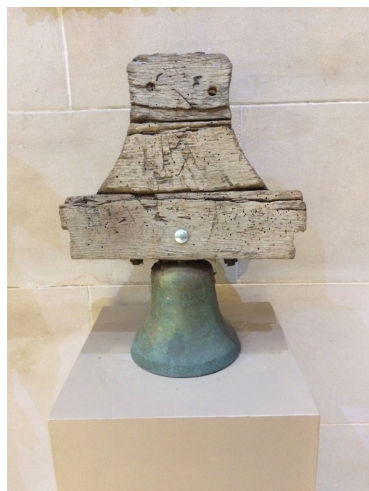
Campana al museu parroquial

Les dues pintures de B. Payeras, sant Sebastià i la Mare de Déu del Carme, no dugueren tanta de sort. Les record a sol i serena sobre l'escenari del jardí de la rectoria fins a la seva total pèrdua.