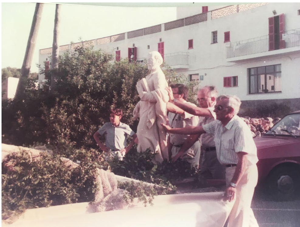
Retorn de la imatge de sant Pere el 1985